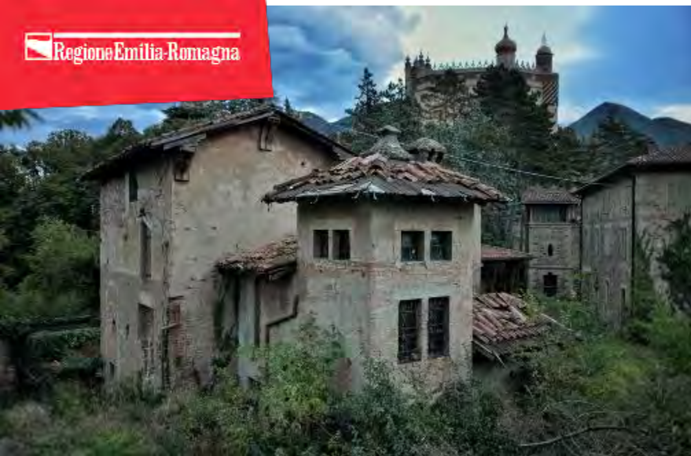
COMPLESSO DEL PALAGIO