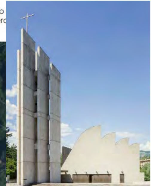
CHIESA A RIOLA DI VERGATO

132 unità immobiliari suddivise in 66 edifici, più il complesso di Borgo Palense esterno al borgo di nuova realizzazione composto da 18 unità. Attualmente ci sono 57 residenti, poco stabili. Il potenziale per il borgo rigenerato