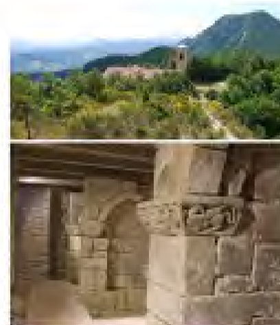
CAMPIONE SCUOLA DI ALTA FORMAZIONE ENTE DEL RESTAURO