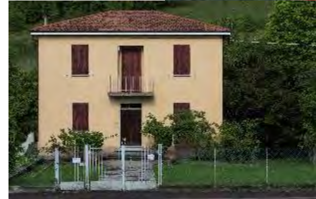
CASA MUSEO DI GIORGIO MORANDI