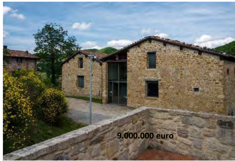
FIENILI DI CAMPIARO E CASA MORANDI