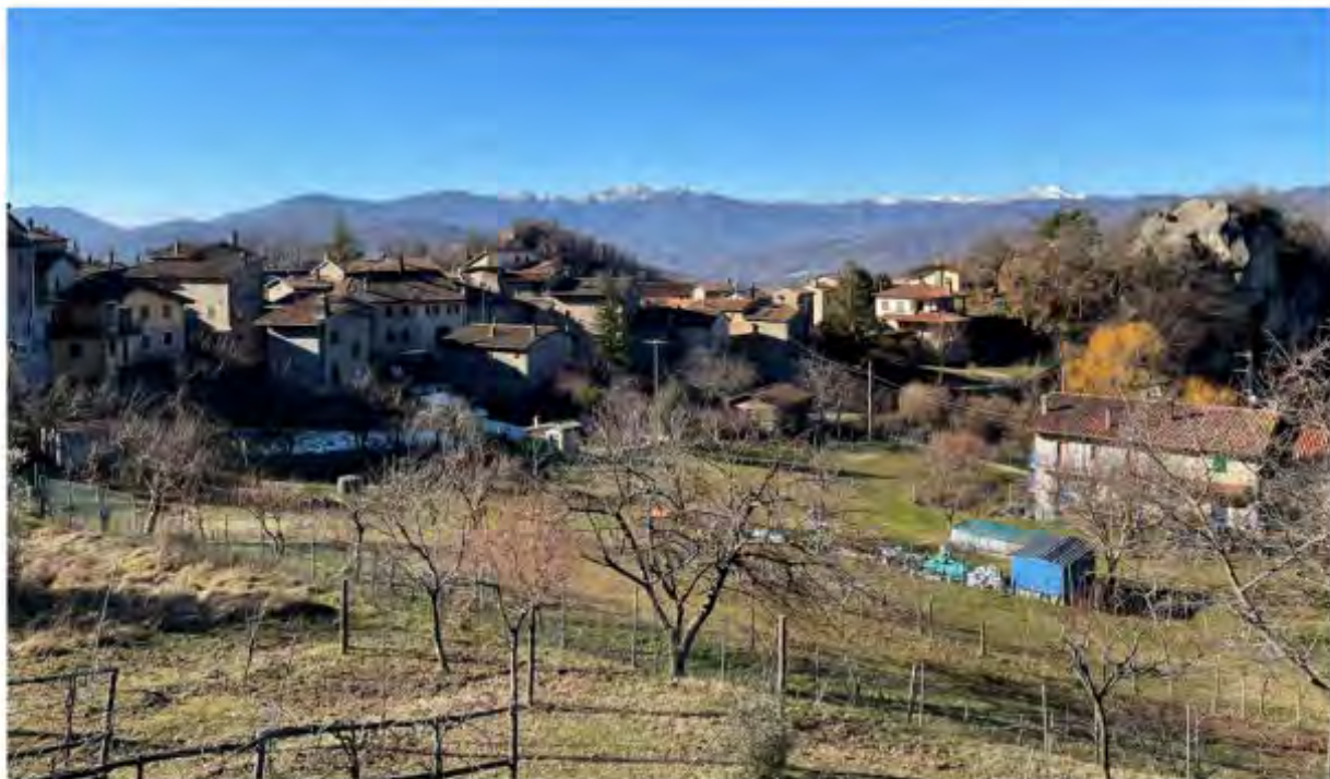
Comune di Grizzana Morandi (Bologna) - Regione Emilia Romagna

Missione 1 – Digitalizzazione, innovazione, competitività e cultura, Component 3 – Cultura 4.0 (M1C3), Misura 2 “Rigenerazione di piccoli siti culturali, patrimonio culturale, religioso e rurale”, Investimento 2.1: “Attrattività dei borghi”- LINEA A